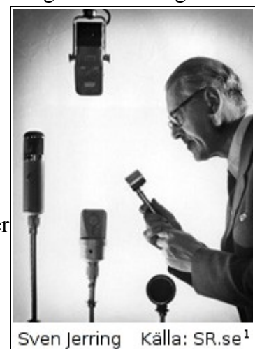
Sven Jerring